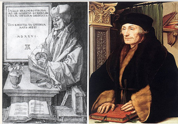
文藝復興時代學者 Desiderius Erasmus 的肖像圖