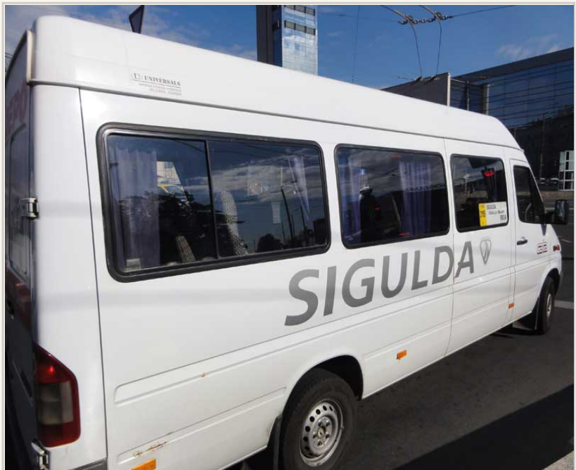
從Sigulda往Riga市區的小型巴士。