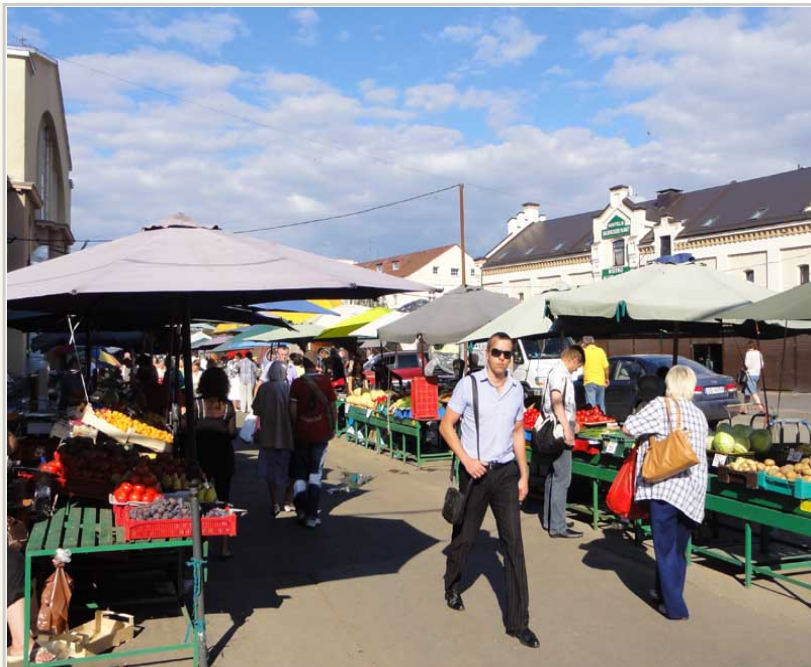
里加車站旁邊的傳統市集。