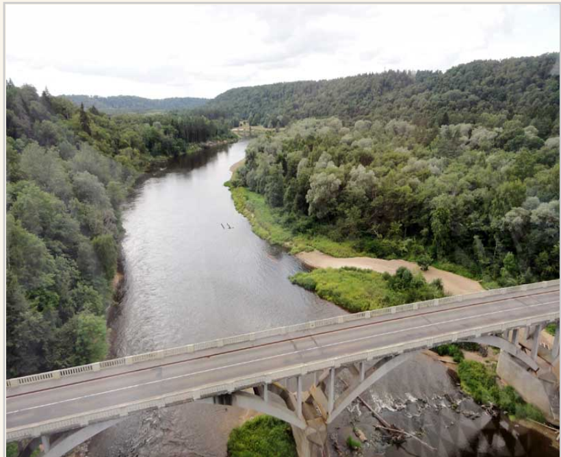
纜車外面的風景很漂亮，下面是Gauja河。