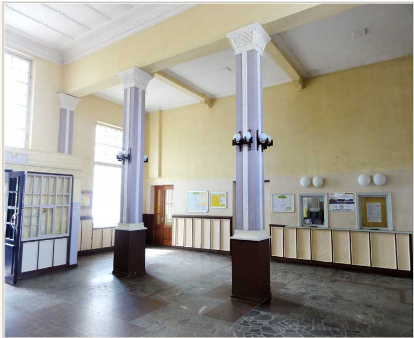
車站裡面真的很復古，只有一個售票櫃檯。