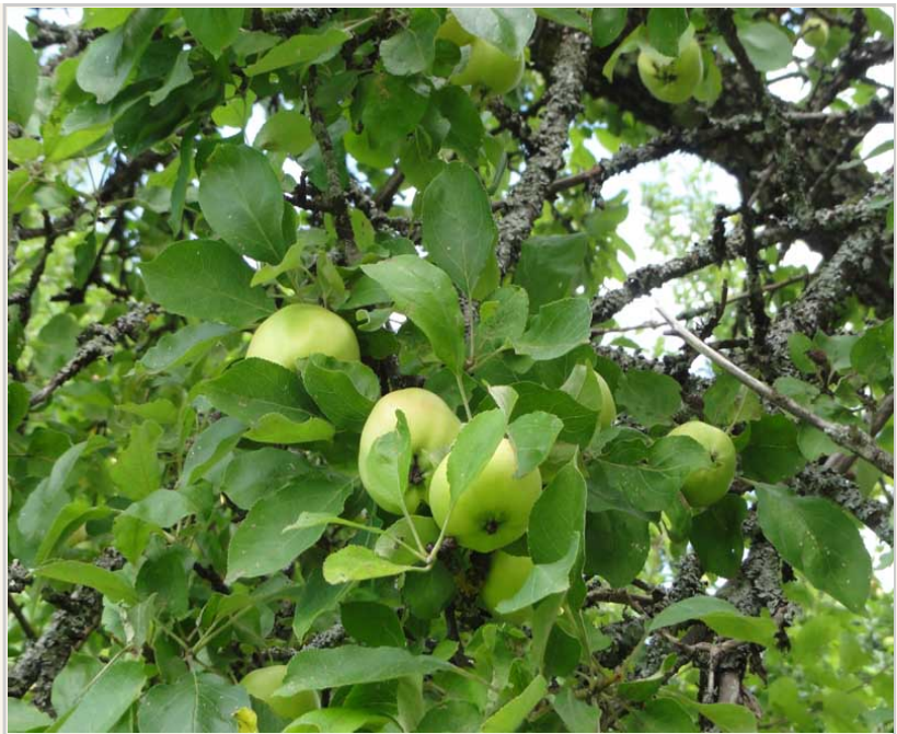
蘋果樹上的青蘋果。