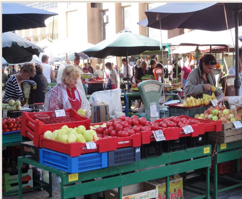
傳統市集的度量衡器具，是前蘇聯時代的古董。