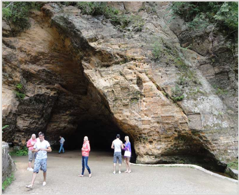
Gutmanis Cave °