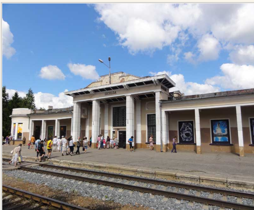
• 這個很簡陋的車站，就是Sigulda車站。