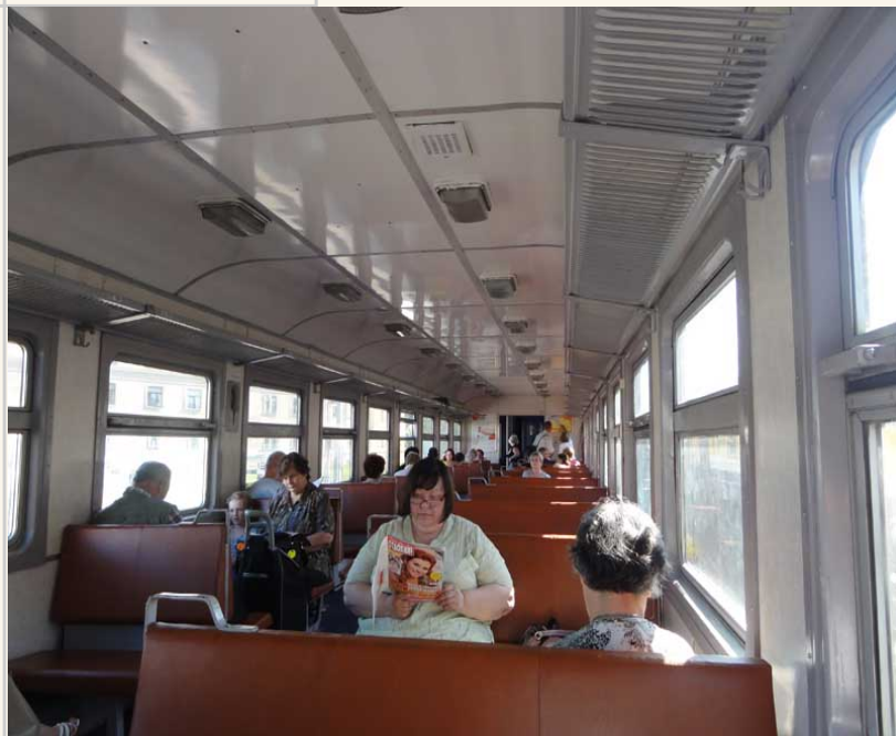
• 拉脫維亞的火車算是很簡陋，跟以前復興號差不多。