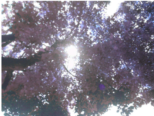
看出去的紫色世界。

由於住在鄉村，周圍綠色動植物俯拾即是，不管是搖曳在風裡的竹子，或是夏夜鳴響的樹蛙，而藍、靛色出現在蒼穹、海洋中，黃、橙、紅色在陽光下、在花瓣上、在落葉裡，當時心裡疑問：「那紫色呢？除了茄子之外還有嗎？」就因為這小小的疑問，開啟了紫色的追尋道路，後來發現了薰衣草、鼠尾草和極少數的花有紫的蹤跡，在其他自然界各處的紫，跟其他顏色相比，也相當罕見，紫色不知不覺中融入了生活。