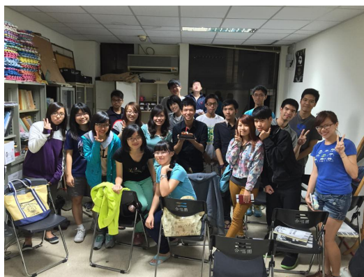
現今大學合唱團的慶生照。

但在熬過那段艱苦日子後，覺得相當值得，因為唱歌成為自己抒發壓力的管道，在高三準備考試繁忙、疲累的生活中，沒有許多娛樂，卻有著許多苦悶，更沒有多餘空閒時間去玩樂，在路上、在浴室、在校園等等，無時無刻都可以唱歌，也在合唱團中學到，「每一個人都是重要的，合唱因為一個人可能會出包，也因為每一個人合作，才能有後交疊感動人的完美和聲。」不像以往教育制度用個人的成績，來評斷、分類一個人。現在就算再忙碌，團練時所有掛慮，也會在享受音樂的當下煙消雲散，回到最單純唱歌的心。