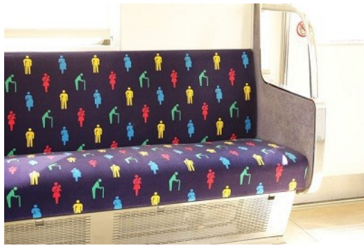
日本的讓座文化並不盛行。