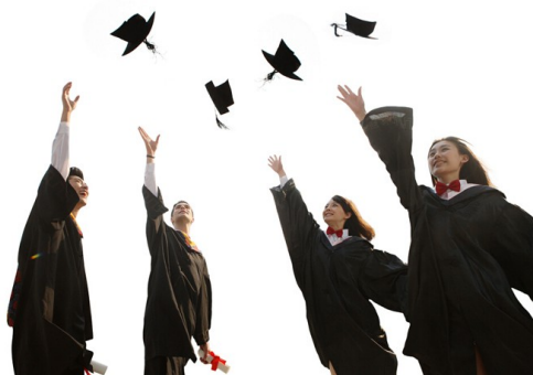
女性越來越多人接受高等教育，改變了對婚姻的想法。

「寧為玉碎，不為瓦全」是最能夠闡釋現代新女性面對婚姻時的心態，與其當個婚姻失敗者，不如當個享受單身生活的不婚族。加上近年來媒體報導的婚姻問題，讓許多未婚者更為卻步，最後造成了這些高學歷、高成就的女性多數選擇單身生活，甚至對婚姻不抱持期望。