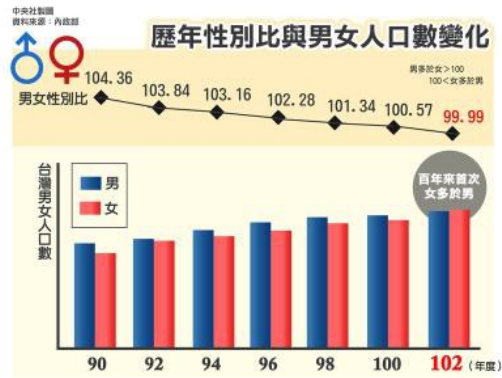
臺灣二〇一三年以前的性別比例，仍以男性居多。