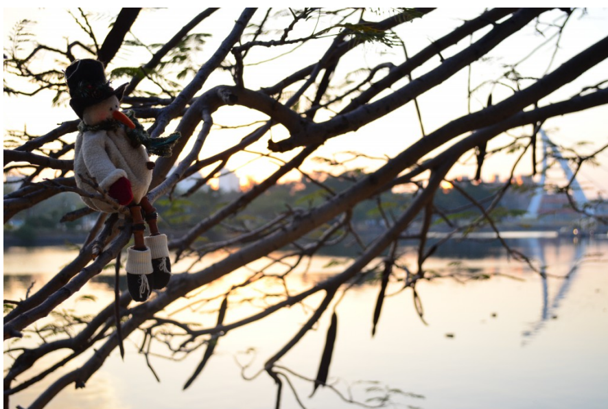
樹上掛了許多類似的玩偶，不管是全身雪白的雪人，或是聖誕老公公，還是穿厚重大衣的布偶人，都會營造出耶誕節的氛圍，掛在河邊的樹桠上就像在凝望著臺南運河。