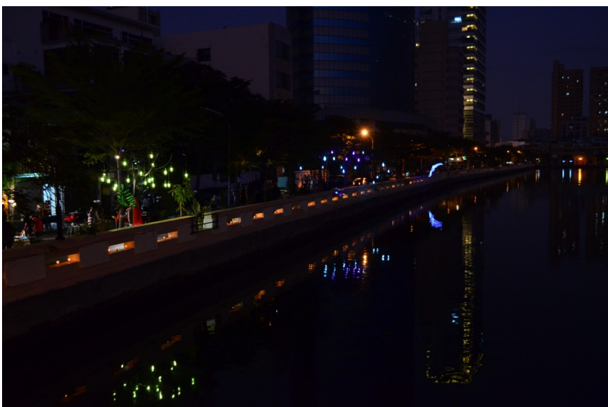
河堤上水面倒映著絢爛的光藝術，而在欄杆洞裡的蠟燭，也燃燒著自己的生命，溫暖了走過的每一個人。