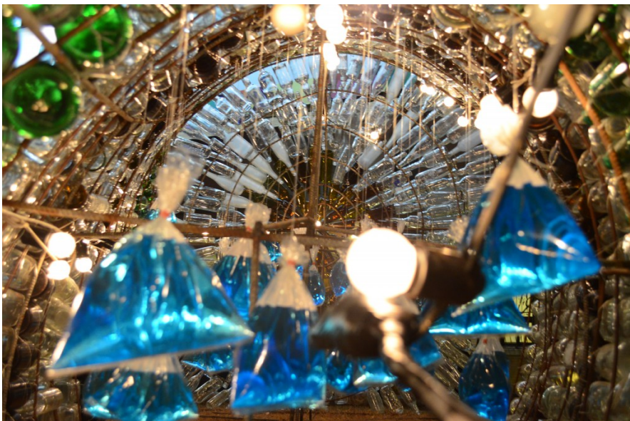
「大海潮聲」內部的燈光在玻璃瓶的反射之下，更加絢爛奪目，而內部又使用青藍色點綴，象徵大海的湛藍。