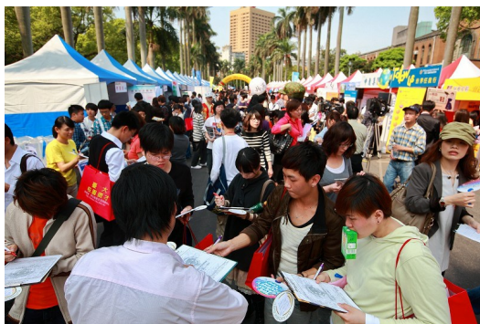
畢業即踏入職場是多數人的選擇，而企業也常到各大校園辦徵才活動。

這些高喊招不到人才的公司，常抱怨現在的年輕人「不願吃苦」，使公司在招募不到人才的情況下，只能引進外籍勞工來彌補空缺，造成臺灣的年輕世代有不少人只能選擇到國外發展，人才流失的惡性循環，是臺灣目前普遍的情況。