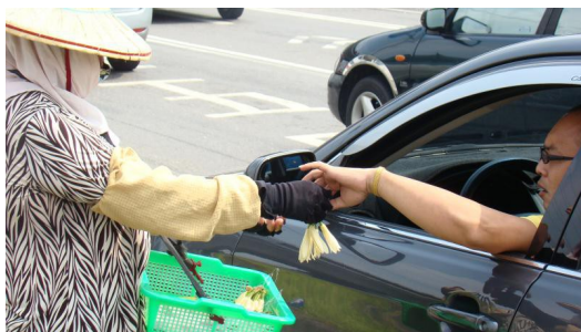
許多老年人沒有工作能力，只能靠著撿破爛或賣玉蘭花維生，靠著微薄的收入照顧孫子。

要將一名小孩撫養成人，需要一筆龐大的開銷，一般的家庭都能感受到這份壓力，更遑論是已經退休，沒有工作能力的老年人。而有經濟能力的第二代如果沒有背負起家庭責任，他們就僅能依靠每個月微薄的老人年金收入補助，或者粗重的工作來維持基本生計。因此，隔代教養家庭成為經濟弱勢的狀況十分嚴重。