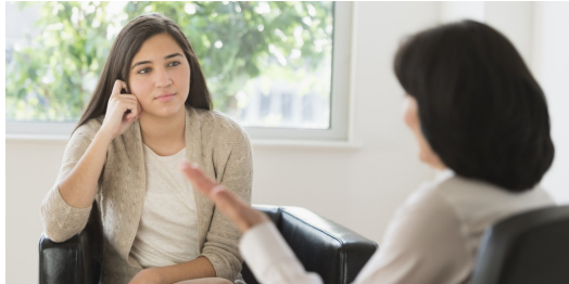
近年來越來越多人開始注重人類心理健康的問題，心理諮商師因此成為許多國家中熱門的新興行業。

現今許多高度開發國家中的人民，因都市化的緣故，生活步調相較於過往變得更為快速緊湊，受到來自社會的精神壓力也日益增加，造成各界開始重視心理層面的相關問題，間接地導致心理諮商師成為一項熱門的新興行業。