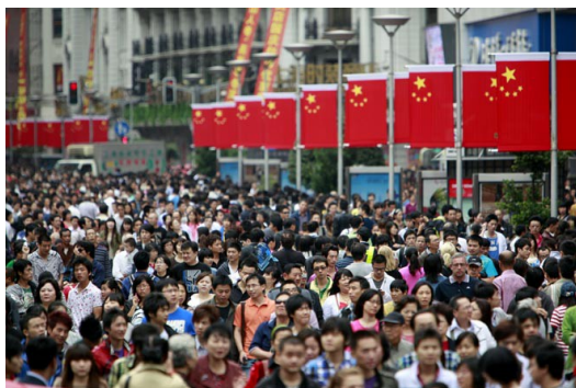
大陸人口眾多，市場也因此相對廣大。

以國際社會發展的基本需求來看，平均每一萬人需要一位心理師，以中國十三億人口進行計算，心理諮商師的需求量高達一百三十萬名，然而現今中國從事心理諮商的心理師專業人員卻不到四十萬人，換句話說在市場上仍有九十萬名的人力缺口。又根據中國官方估計，當地至少約有一點九億的人對專業的心理諮詢是有需求的，心理諮商師的就業發展自然是不言可喻。