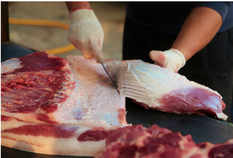
豬肉攤販現場解剖豬肉，熟練地將肥、瘦分離。老闆說自己從事這行已經二十幾年了，從可以私宰豬隻到現在會被罰款，他也在賣豬肉的生活走過時代的變遷。