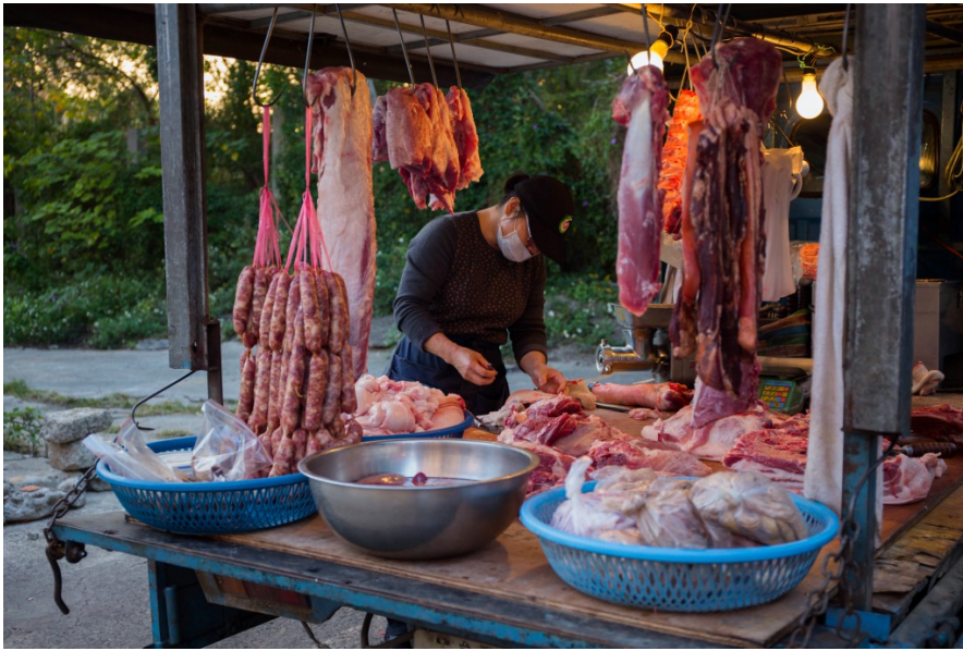
由於豬肉不能長期曝曬於陽光下，因此載著豬肉的卡車會挑選較為陰涼的地方停靠、販賣。攤販也會利用黃色的燈泡來照射吊掛的豬肉，讓它顯得更更有光澤。