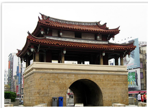
新竹市舊城區擁有古蹟、文化背景，附近商家林立，適合觀光發展。

新竹市政府規劃將公共自行車「Wind-bike」優先於舊城區推動，設置據點在東大路、西大路、南大路、北大路等依附於圓環的道路，並結合舊城區獨有的文化背景、古蹟，將小而美的都市打造成富有人文氣息的慢活城市。公共自行車的設置可以幫助居民來往、學生通勤之外，也提供外來遊客騎乘觀光舊城區。中華大學休閒遊憩規劃與管理學系專任副教授張馨文表示，舊城區商家密集，結合公共腳踏車的話，遊客逛舊城區時更加方便能到達的地方越多，可以促進商圈發展也能幫助城市行銷，讓遊客藉由腳踏車看見更多新竹的美。