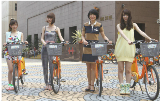
新竹市政府正進行著公共自行車租賃系統的規劃，參考臺北市U-bike的成功經驗，期許能帶給市民更好的生活體驗。

全世界已經有600個城市使用公共自行車租賃系統，改善了城市長期以來的交通混亂與空氣汙染，同時也有利環境、幫助使用者節省通勤費用並增進身體健康。臺灣許多城市加入了公共自行車系統的行列，臺北市、高雄市、臺中市推行的公共自行車滲透率以及使用率皆高，達成的效益之高使其他城市也躍躍欲試。