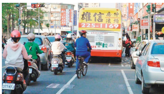
新竹市道路狹窄，汽車機車自行車互相搶道，行車環境並不友善。

行道不足、路面凹凸不平等，甚至有網友認為新竹市的交通應該把現階段的狀況進度歸零，重新來過，大部分傾向於新竹市並非公共自行車實施的友善環境，普遍不贊同這項提議。