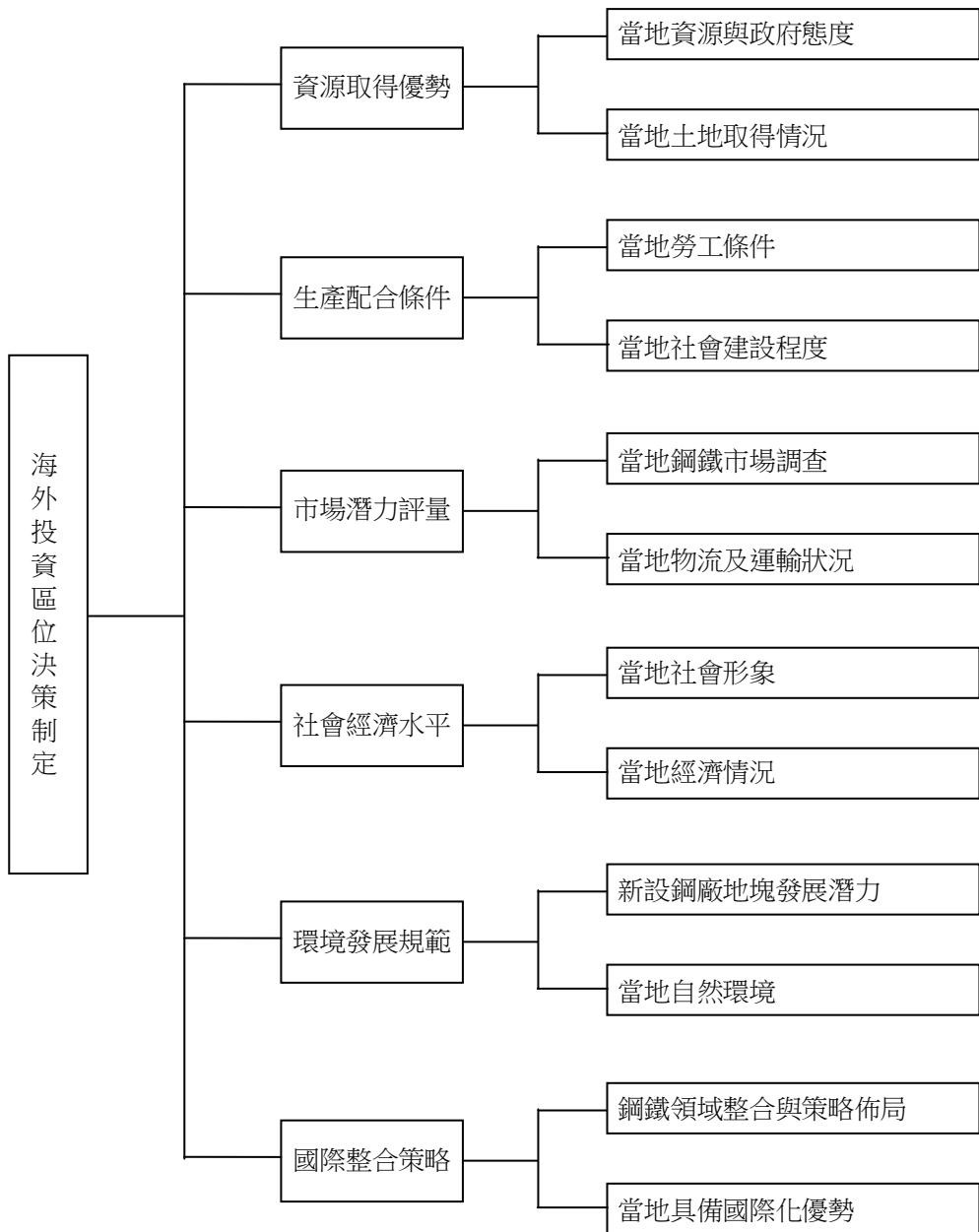
圖 2 海外投資區位決策權重評估架構圖

面逐一進行一致性檢核，並將一致性比率超過 0.1 者，予以剔除。經 expert choice 軟體分析結果，此五份訪談問卷中，每份問卷的一致性比率依序為均小於等於 0.1，達本研究所設定之標準，故能做為本研究計算相對權重的使用。