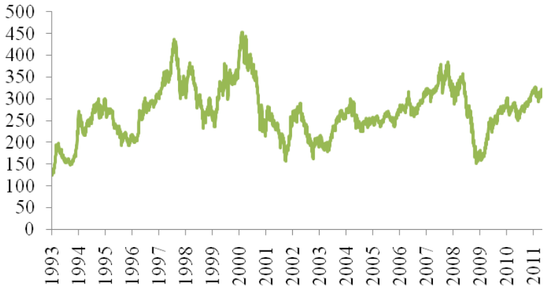
圖 1 MSCI 台股指數