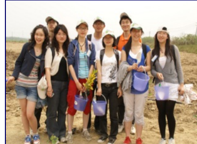
今年3月，10位北大交換生到交大台南校區參與環保植樹活動。

看到交大學生具備人文素養，且學校對學生課業外的表現很關注。「北大較缺乏整體、常規的藝術展出、我們將很想念交大很有氛為的藝文空間。」