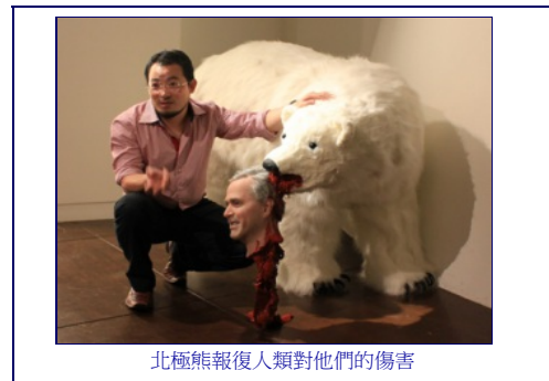
北極熊報復人類對他們的傷害

自2006年起黃瑞芳從科技文明省思的角度，關注全球氣候變遷的議題，透過以幽默逗趣的手法將原本被人類視為再可愛不過的企鵝動物，轉化為對人類展開反撲示警的全球暖化守衛前鋒部隊。其創作形式包含繪畫雕塑裝置及近來熱中的以「街頭游擊」形式，在歐洲城市展開企鵝突襲的雕塑行動計劃。