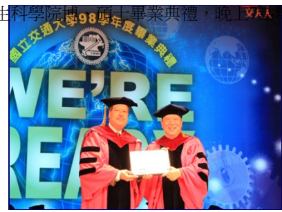
吳重雨校長(右)頒贈名譽博士學位予艾哈邁·齊威爾教授

齊威爾教授是史上第一個利用雷射技術直接觀測到化學反應的科學家，開創新化學研究領域，稱為「飛秒化學」(Femtochemistry)，更進一步推廣至「飛秒生物學」(Femtobiology)，為物理、化學、生命科學及相關科學帶來空前的科學革命，此成就讓他在1999年獲得諾貝爾化學獎。齊威爾教授也獲得尼羅河大領勳章(the Grand Collar of