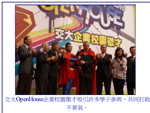
交大OpenHouse企業校園徵才吸引許多學子參與，共同打敗不景氣。

今年是交大在台建校的52個年頭，與國際上歷史悠久的高教學府相比仍屬年輕，吳重雨校長以一年52個星期作為比喻，象徵此刻的交大正迎接另一個新年，把今年和過去的成就，視為嶄新成長週期的開端。人才是永續發展的關鍵，在「教」與「學」雙重領域投資和努力，就會有加倍的回報，「交大校友的成就、在座的同學、全體教職員的努力，就是『教』與『學』並施的最佳見證！」