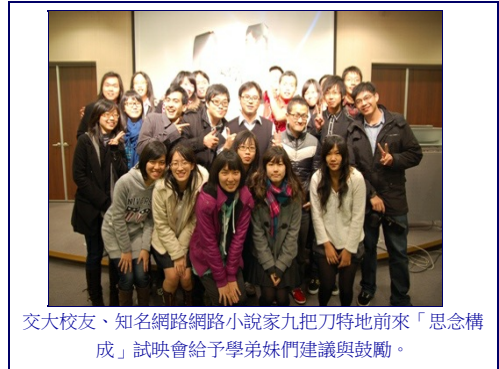
交大校友、知名網路小說家九把刀特地前來「思念構成」試映會給予學弟妹們建議與鼓勵。

群聯電子與「思念構成」合作推出專屬隨身碟，內有「思念構成」完整電影資料。潘健成說，「當時蔡翼鍾來找我，他想要出專屬隨身碟，可是裡面的電影資料不能被copy。有這個可能嗎？有！我們工程師想出了方法，這個方法還申請專利，現在美國大廠也要跟我們買下這項技術。所以我要感謝學弟妹們，給我們這麼棒的新想法！」這款獨一無二的「思念構成」隨身碟將在電影正式上映後推出，屆時喜愛「思念構成」的觀眾能收藏並加以利用。