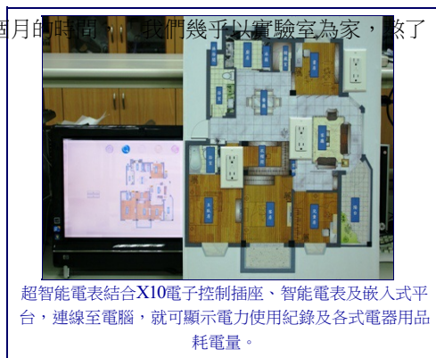
超智能電表結合X10電子控制插座、智能電表及嵌入式平台，連線至電腦，就可顯示電力使用紀錄及各式電器用品耗電量。

從決定參賽到正式上場，團隊只有不到兩個月的時間，他們幾乎以實驗室為家，熬了好多、好多個夜，賽前每天也只睡兩、三個小時很累，有時也很挫折，但是完成後很有成就感！參加比賽看到了大家的實力，讓我們在舞台上多了一份經驗，「超智能電表」也實踐了我們當初設定的目標，希望能夠幫助大家，為世界帶來改變！」