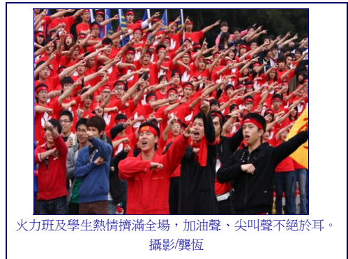
火力班及學生熱情擠滿全場，加油聲、尖叫聲不絕於耳。

陳校長並鼓勵學生，要熱情不要激情、要盡興但要理性，競爭之餘不要紛爭。新竹市長許明財也特地撥空前來，「交清大是新竹市的驕傲，四十二年來兩校在運動場上展現才藝跟才能，有兩校是新竹的驕傲，讓新竹在世界上揚名立萬。」許市長勉勵學生，今天以交清大為榮，畢業交清大以各位為榮，未來新竹市以各位為榮！更祝福梅竹賽順利成功。