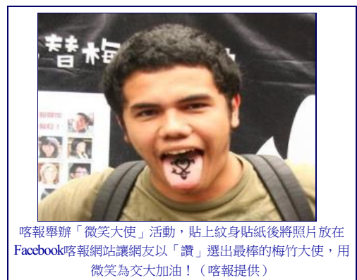
喀報舉辦「微笑大使」活動，貼上紋身貼紙後將照片放在Facebook喀報網站讓網友以「讚」選出最棒的梅竹大使，用微笑為交大加油！

開幕最後，由緊張刺激的田徑表演賽及熱力四射的啦啦隊掀起梅竹賽的序幕。儘管只是表演賽，選手都拿出最精湛的實力跟熱情賣力奔跑，火力班的加油聲及擊鼓聲不絕於耳，一開始由清大拉出明顯的差距，最後交大奇蹟似的逆轉勝，期待庚寅梅竹能像田徑表演賽一樣，奪回總錦標。兩校啦啦隊也展現練習許久的成果，高難度的拋接動作讓觀