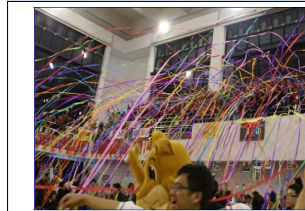
女子排球賽結束，交大以八比三獲得總錦標，霎時七彩彩帶從清大體育館二樓傾洩而下，歡慶交大奪回總錦標！

第二天登場的是靜態、靠腦力的橋、棋藝以及最令學生關注的網球、棒球及男、女籃球正式賽，橋藝戰況激烈，雙方各有拉距但最後清大領先，但第三天賽事交大用耐心、智慧及經驗將比數追回拿下勝利；兩校在棋藝競賽中展開冷靜沈著的競爭，象棋部分平手，圍棋兩分領先，贏得棋藝錦標；棋藝確定得點同時，在清大棒球場的交大同學正為了平手七局而開始的第八局「突破僵局制」緊張的冒冷汗，交大棒球隊一掃去年因雨停賽的苦悶，