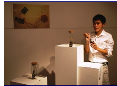
充滿秘密的玻璃罐，讓聆聽者自我解讀。

三罐玻璃罐，會不會透露出誰去整型、誰換情人，還是其實國王的耳朵是驢子的耳朵？夏承捷的《流言》讓觀眾對著瓶子說話，把聲音和情感密封在瓶中，由下一位聆聽者天馬行空的去想像發揮。「新聞都在亂講話，看了有點生氣！是不是大家都不用為自己說的話負責？」為了呈述此社會現象，夏承捷讓觀眾留下想說的話，話語是否為事實我們無法確定，是哪位神秘的人物留下訊息我們也不清楚，卻提醒了下一位使用者，我們能否相信？又該如何解讀？夏承捷轉化羅蘭巴特的「The death of the author〈作者之死〉」理論，發言者不用為言語負責、接收者也會自我解讀，「作者完成後就和作品毫無關聯了，因為原意已消失，賦予意義的是閱讀者！」