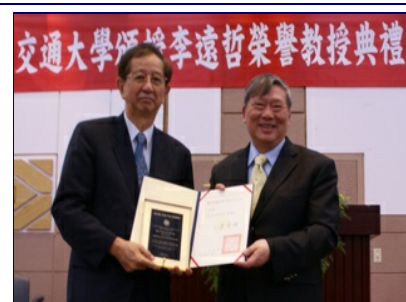
1986年獲得諾貝爾化學獎得主、前中央研究院院長李遠哲(左)昨(11/30)正式成為交大榮譽教授，由吳重雨校長

李教授表示，自己本身在新竹長大，每次回新竹都感覺特別溫暖，半世紀前到清華大學念研究所，那時的台灣雖然貧窮，交大、清大也都才初成立，但交大有電子計算機、清大有原子爐，貧窮中仍能感受到一股向上的力量，「讓我一直期待能回到家鄉，跟家鄉父老同甘共苦。」15年前李院長回到台灣擔任中央