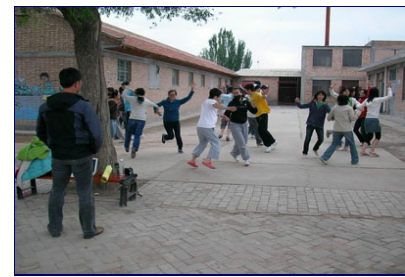
下午的團康活動，志工帶領學童們玩得不亦樂乎。

交大吳重兩校長表示，「專業，應從服務開始。」在專業精神中，利他助人的面向，逐漸變成新一代專業人愈來愈重視的核心價值。透過國際志工活動，學生能夠從文化及公共事務的面向，了解並反省自己，體認自我在世界上扮演的角色及責任，是與國際接軌的另一種方式，並盡一份身為地球公民的責任。