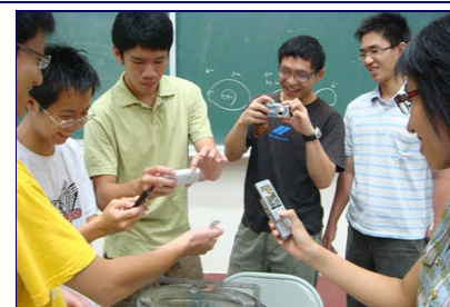
「奈米科技探索」課程，同學十分 喜愛助教帶來的沙漠蜥蜴， 紛紛拿起相機拍照。