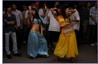
女學生不吝展露曲線，為舞會點燃熱情。

呼應主題威尼斯之夜，在勁歌熱舞之外，交大畢業舞會還舉辦了面具裝飾競賽，吸引16位同學報名參加，獲獎的面具都被裝飾在現場的舞台，同學心思、手工細膩，有的在面具上鑲亮片、羽毛，更有學生用色大膽、彩繪面具，讓現場氣氛更加「神秘威尼斯」。