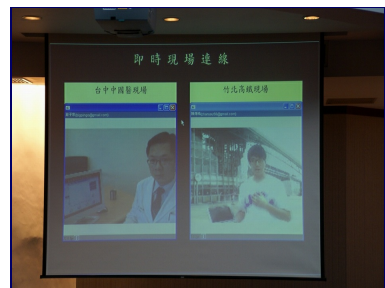
現場即時與竹北高鐵病患、台中中國醫藥大學附設醫院連線。