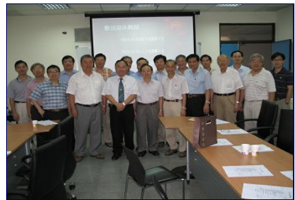
圖6 全體與會老師合照