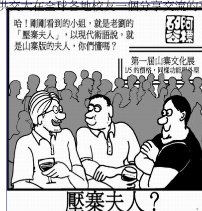
矽谷阿標最新創作壓寨夫人

閒暇之餘最喜歡畫漫畫，1998年起開始在玉山通訊以「胡說中到」連載漫畫引起高科技界矚