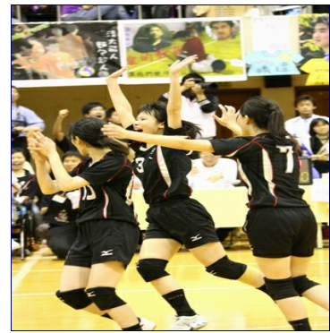
交大女排開心得分。

己丑梅竹交大拿下羽球、網球、男籃與女籃等四個正式項目點數，此外桌球體資體保競賽、女網表演賽、女羽表演賽與女羽體資體保競賽等非正式項目，精彩的表演與競賽也獲得滿堂彩。