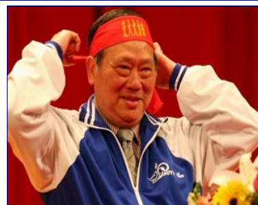
重兩校長為自己綁上交大火力班專屬的紅色頭帶，祝福己丑梅竹成功順利。