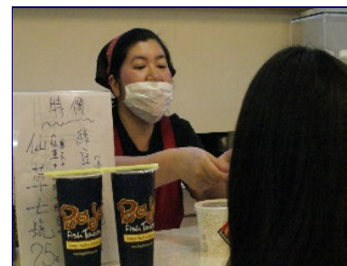
電影「海角七號」當紅時，豆花阿姨順勢推出「仙草七號」，目前「仙草七號」開學特價中，物美價廉受到學生喜愛！

看著豆花阿姨戴著頭巾、口罩在店裡忙碌的身影；招呼客人的親切話語及微笑，一定會認為她在家是勤儉持家、慈祥和藹的母親，其實豆花阿姨目前是「單身貴族」。由於父母長年中風纏身，豆花阿姨放棄青春和夢想，在父母發病的十八年歲月裡，她的生活只為了「賺錢」提供父母完善的醫療。現在母親雖已往生，但豆花阿姨對於工作仍懷抱著滿腔熱情，在校園餐飲業服務十餘