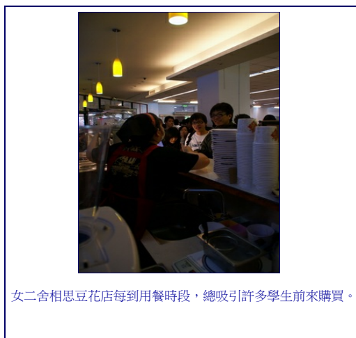
女二舍相思豆花店每到用餐時段，總吸引許多學生前來購買。

貼心服務、熱情態度串起人際網絡 旅行觀摩各地美食提升服務品質 從事餐飲業數年的豆花阿姨明瞭單是產品超值是不夠的，服務態度更是顧客著重的焦點，她秉持「每一位顧客都是第一個顧客」的態度，使自己永遠保持從事服務業的熱情與初衷。豆花阿姨表示，透過與學生的互動，可以了解目前學生最關注的議題及學生活動，期末考準備