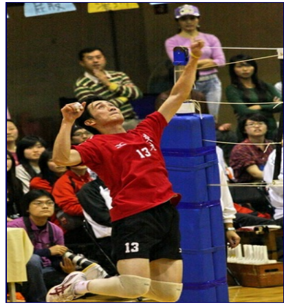
交大男排奮力殺球。

最後一場掌握關鍵勝負的女子排球，首局清大女排即以二十五比二十二先發制人，最後兩局以二十五比十八、二十五比十五連三局獲勝，搶下最後一點獲得己丑梅竹總錦標。終場結束吳重兩校長與交大火力班成員共同大聲齊唱交大校歌，鼓勵所有的選手與同學們不要氣餒，同時也宣示交大明年捲土重來爭取總錦標的決心。賽後bbs也湧入大量討論文章「雖然七連霸失利，不過讓我們看到交大人的驕傲與風度」、「交大校隊辛苦了，謝謝大家讓我們看了精采的比賽」、「一起為自己母校加油，是最令人感動的一件事」，紛紛感謝校隊、籌委、火力班及參予同學共同努力帶來的精彩回憶。