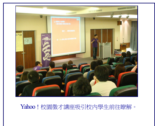
Yahoo! 校園徵才講座吸引校內學生前往瞭解。

雅虎資訊公司本次在交大辦理講座，公司內部人資表示此舉除了是要招募員工外，也為了長期的人才經營、推廣網路產業的技術，更重要的是培育未來網路之星，像是由交大學生創立的無名小站，開啟社群服務的觀念，在網路資訊發展極具份量即是一例，而透過長期的合作正是期待再迸發出一顆新星。