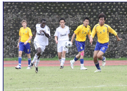
清、交兩校球員無不奮力一踢。

上半場一開始雙方尚未熟悉地形，形勢有些混亂，不少球員因鏟球的關係跌倒，後因清大犯規，交大李厚笙罰踢自由球搶先攻得一分，不過清大也不讓交大專美於前，清大選手魏瑜甫趁著守門員滑倒，踢進一球。中場清大球員多次射門未果，交大守門員趙時恆精彩撲球，