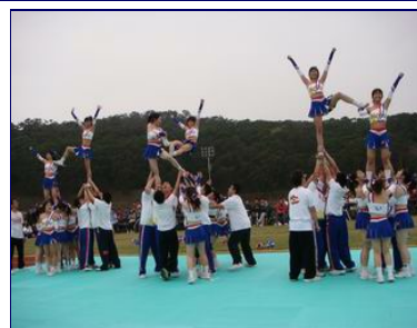
戊子梅竹開幕，交大競技啦啦隊帶來精彩表演。

「不要吝嗇於付出，因為能夠付出的人是最幸福的人。」己丑梅竹歡迎大家一起發揮熱情與愛心。