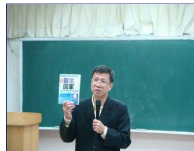
《醫學基礎概論》以簡單有趣且貼近生活的上課方式，使學生瞭解醫學小常識，讓你把醫生帶回家。

本學期「醫學基礎概論」課程包括藥物作用的原理及副作用、心血管疾病、頭痛與失眠、呼吸道疾病等15堂常見疾病的預防與治療課程，相關課程內容請參考以下附表。