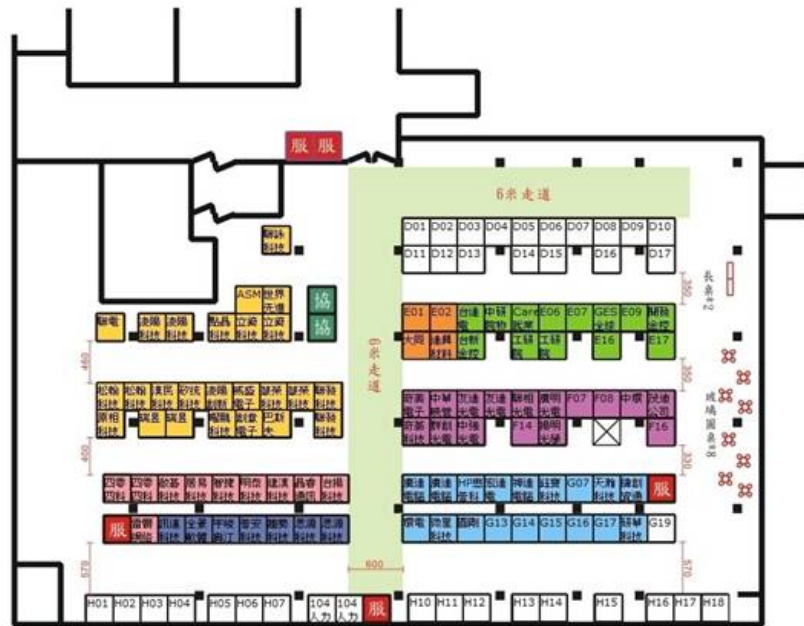
4/11就博會綜合一館B1工作地圖86間企業按產業別分區場地配置