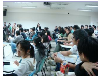
《醫學基礎概論》第一堂課總是座無虛席，經常造成選到課的同學卻沒有位子坐的現象。