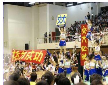
戊子梅竹閉幕，交大競技啦啦隊精彩演出博得滿堂彩。

而今年比賽最後到底獎落誰家呢？是追求七連霸的交通大學，還是想逆轉勝的清華大學呢？想知道結果，千萬不要錯過一年一度、精彩可期的梅竹賽。三月六號到三月八號，歡迎來交清校園體驗熱鬧滾滾的梅竹錦標賽。己丑梅竹籌委會歡迎您的光臨。