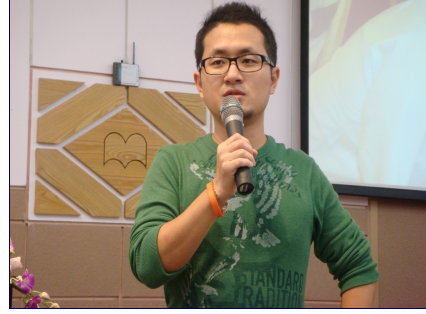
知名校友「九把刀」柯景騰學長返校演講。

分享他成為知名網路作家背後鮮為人知的故事。九把刀是台灣受歡迎的網路作家之一，其寫作風格多變，至今已出版45本書，2004年出版《功夫》後一舉成名，躍升為台灣出版界的暢銷小說家，本次演講座無虛席，吸引了兩百多位聽眾。