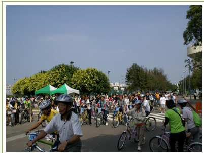
◆參與騎腳踏車的眾多民眾。