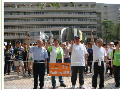
◆鳴槍起走。由左至右為新竹市長林政則、天下雜誌群發行人殷允芃、交通大學校長吳重兩、台灣聯合大學系統總校長曾志明。

本次活動特別規劃「環保市集」邀請民眾親子同樂，如「荒野保護協會」紙風車製作、「大地旅人環境教育工作室」腳踏車動力產電、知名設計家具「Flexible Love」瓦楞紙製作、金車大塚贈品發送、捷安特自行車體驗等，讓您實地體驗樂活環保新主張。在終點站，主辦單位特別邀請金曲獎得主「野火樂集」演唱，分享屬於原住民的音樂詠嘆。在奔放、洋溢的熱情鼓聲中，也讓民眾在清爽的天氣下隨著音樂“動”了起來。