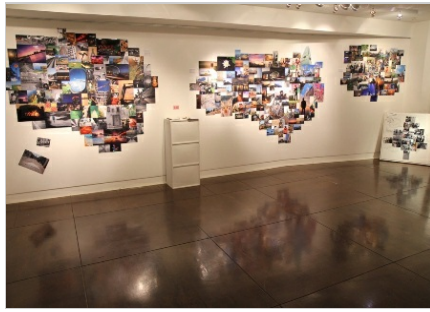
攝影社以生活點滴闡述鏡頭裡的世界

之易邀請大家靜下心慢慢欣賞；二樓展場以生活點滴闡述鏡頭裡的世界，紀錄下每個人感受到的美。除了靜態攝影，攝影社也用縮時攝影拍下時間變換的影片，重現流轉的時光。