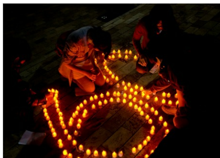
交大傳科系學生31日世界地球日當天於新竹市東門城發起關燈一小時活動