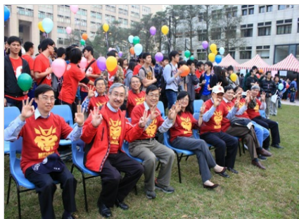
交大校內主管高舉三連霸手勢

號。隨後也吃下草「梅」，象徵打敗清華大學，並施放色彩繽紛的氣球，祈求勝利。誓師大會現場設置釣青蛙、射青蛙、打青蛙等趣味小遊戲，以輕鬆的氣氛舒緩已逐漸醞釀的緊張氛圍。Google也在周邊設置加油集氣戰，交大學生們只要在google+加油，就可以為交大累積人氣。