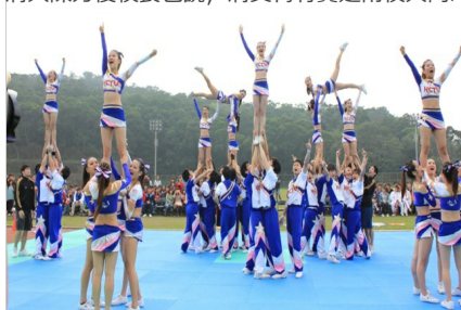
充滿活力的交大啦啦隊每年都帶來精彩的演出

清大陳力俊校長也說，清交梅竹賽是兩校共同的資產，也是紀念兩校校長而存在的運動賽事，今年適逢梅校長逝世五十周 年，整理梅校長過去的日記時發現梅校長常提及交大，對當時交通大學 在台復校也極度重視，所以清交合作是其來有自。而新竹也在清華、交 大的設校下牽動竹科園區發展，對高等教育與高科技發展寫下光輝的一 面，「如果清大沒有交大、交大沒有清大，會是多麼可惜的事！」陳 力俊校長也說，人生有許多階段，學生都是青春年少、血氣方剛的鬥 士，期許學生們盡情享受這場青春盛宴。