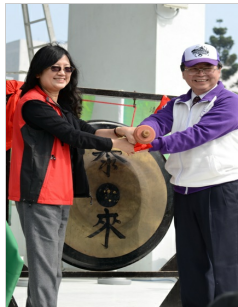
壬辰梅竹在兩校校長共同開鑼下盛大展開

壬辰梅竹在豔陽高照的好天氣展開序幕，參與賽事的選手們也在師長與 火力班搖旗吶喊下一一進場，面對如雷的歡呼與掌聲，交大選手們不僅 展現最大的笑容，更比出三連霸手勢，展示交通大學蟬聯總錦標、拿下 三連霸的決心！