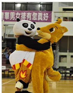
交大吉祥物竹狐與清大吉祥物熊貓擁抱言和。

壬辰梅竹賽於3月4號晚間落幕，今年因為兩校校隊上場資格認定問題，雙方無法達成共識。壬辰梅竹籌備委員會於3月3日晚間(原訂女籃賽正式開賽前)，宣布諮議會傍晚開會以8:2通過壬辰梅竹賽全面不計點。