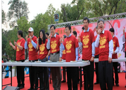
交大校內主管吃草「梅」，象徵打敗清大

號。隨後也吃下草「梅」，象徵打敗清華大學，並施放色彩繽紛的氣球，祈求勝利。誓師大會現場設置釣青蛙、射青蛙、打青蛙等趣味小遊戲，以輕鬆的氣氛舒緩已逐漸醞釀的緊張氛圍。Google也在周邊設置加油集氣戰，交大學生們只要在google+加油，就可以為交大累積人氣。