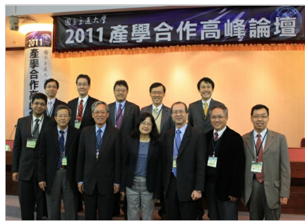
2011 產學合作高峰論壇主軸為「亞洲智財新契機」，邀請亞洲地區產學合作領域之專家學者

與座談會，分享經驗與創見，共同激發出創業創新能量，強化跨國產學合作之機會，推動台灣與亞洲各國，建立緊密型的國際產學研合作聯盟關係、以及跨國產學合作推動區域創新發展。