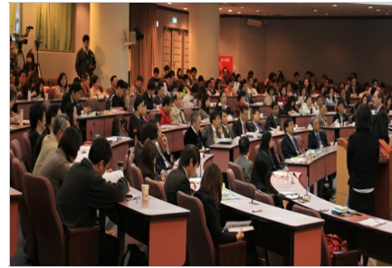
2011 產學合作高峰論壇座無虛席，吸引眾多產學研界專業人士共同參與

國立交通大學校長吳妍華致詞時指出，交大長期致力於發展智財推廣與技術行銷，成功將研發能量轉化為技轉的含金量，每年的技術移轉案件數量及技轉授權金額皆成高度成長。此外也直指目前學研界的所研發的技術與成果，不到10%的比例成功轉移到業界，交通大學產學合作高峰論壇提供一個產學研界三方的分享及溝通平台，藉由意見分享、經驗傳承及建立共識，期望匯集各方智慧，強化跨校與跨國的合作機會，讓亞洲區域的產學合作能夠持續創新發展，使資源發揮最大的功效與影響。