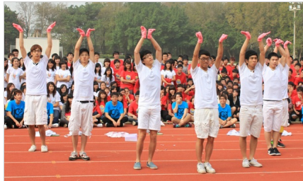
「肝鐵人」精湛舞姿搭配逗趣的表情，笑果十足

到人類進化史，應數系以誇張的造型獲得「最佳造型獎」，齊全的服裝道具可說是實至名歸；以賽德克·交大為主題的機械系帶來精彩的舞蹈表演，更以擊敗「清兵入關」暗示明年壬辰梅竹的勝利，獲得「最佳笑果獎」。