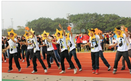
資工系精彩的表演拿下創意繞場「最佳表演獎」

交通大學100學年度運動會於7日盛大展開，晴空萬里的好天氣吸引交大教職員工生脫下冬衣走出戶外，從田徑賽、環校道路競走到趣味競賽，熱情參與這一年一度的運動盛會。