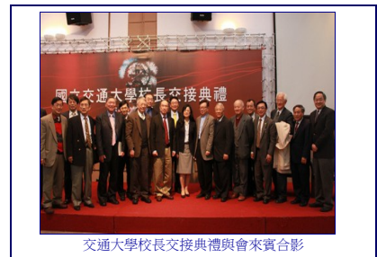
交通大學校長交接典禮與會來賓合影

在吳重兩校長奠定卓越的辦學績效基礎下，新任吳妍華校長提出交大願景，期望以「培育跨領域領導人才」以及「尖端研究及應用」為柱，以「國際化」、「校際合作」、「教研相長」為樑，持續推動交大成為世界頂尖一流大學，並打造交大成為全球高科技產業研發與創新之重鎮。她並表示，上任後肩負著培養具有厚實科學基礎、自主學習能力、創造力、溝通能力、批判思辨能力、敬業樂群、人文關懷、社會責任、視野寬廣及世界觀之領導人才的使命，並且希望藉由人才培育以及頂尖研究孕育出有助於人類社會的新觀念、新思想、新知識與新科技，為全球永續