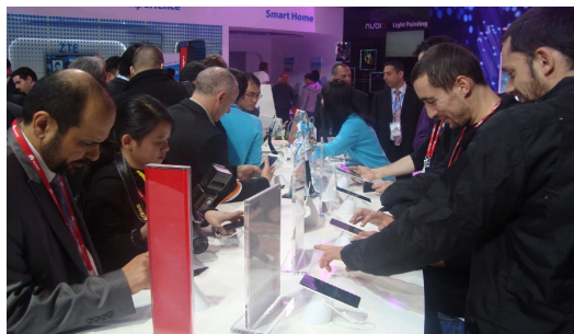
科技展上各類先進產品滿足人類的需要，也讓新創團隊有概念發想的空間。

二〇一五年三月更是科技技術、人類對未來生活構想大鳴大放的時光，在三月初，一年一度的世界通訊大會MWC 2015在西班牙盛大展開，展示的科技產品包羅萬象，除了當今火紅的穿戴式裝置和現有設備再升級，各大廠商更提出對於人類未來生活願景的規劃。繼MWC後，接連幾週的發表會，蘋果、三星、HTC等更提出因應物聯網潮流的相關商品及公司對科技發展的展望。這一切的動作背後都有一個共同的目的，滿足人類的需要，給人們更好的生活。