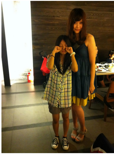
高中謝師宴，我和同學形成「巨人和哈比人」。

小巧的體型在生活上的影響一時間還真的無法道盡。上課一定要坐第一排，游泳池游到中間一定要一股作氣游過去不能停留（停在中間恐遭「滅頂」），照相時站在後面就會被擋住，這些基本原則就不再多贅述。而我認為最辛酸的莫過於衣著、鞋子等服裝搭配，衣服和褲管總是不合身且過長，穿在模特兒身上看起來十分有型的衣服，一旦套在自己的身上就看起來鬆垮垮地撐不起來。