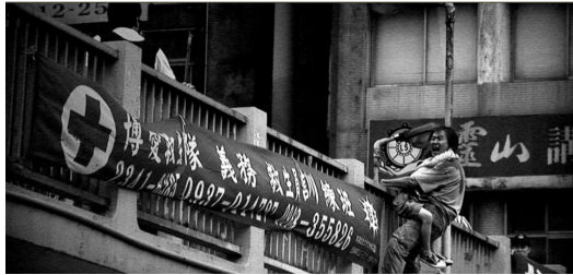
整部電影都是以黑白色調呈現。