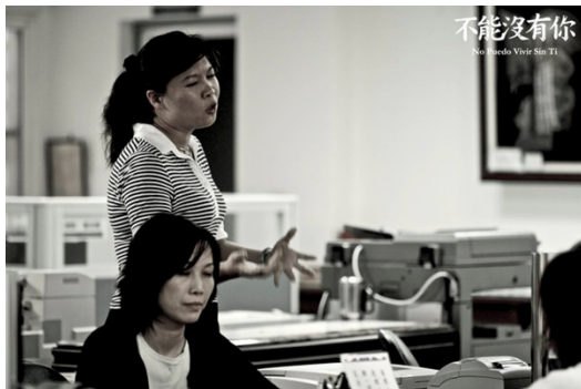
官僚的冷漠態度，是本片批判的重點之一。

諷刺的是公務員們絕非凶神惡煞，故事中也沒有官逼民反的極端情節。相反地，民意代表及高官們身為公僕，臉上總掛著微笑、和顏悅色，背後卻是無所作為、虛應故事。基層的機關人員則是雙手一攤，配上一句「依法行政」，便將所有責任歸咎於法律，淡然敷衍地一乾二淨。一次次的冷漠敷衍，於無形中匯集成了一股被動的罪惡，而國家機器就此淪為名副其實的機器，運作起來冷酷且不帶有一絲溫度。