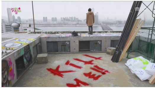
主角留下Kill me的訊息。

「你的記憶就是我的記憶，你的痛苦就是我的痛苦，你能做到的我也能做到，因為我就是你。」男主角對鏡中的申世奇如此保證，他的意志讓其堅強、他的自信讓其有重新站起來的勇氣。在找回所有的真相後，雖然心中充滿著恨意和愧疚，但最後還是選擇與女主角一起和過去道別，釋懷讓他們得到真正的幸福。