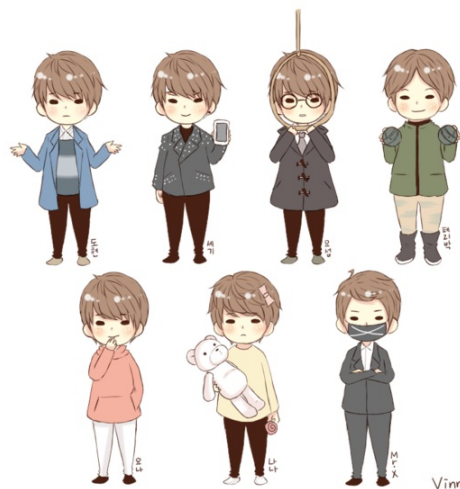
無論外型或性格，各種人格皆有鮮明的特色。

在多重人格相關的作品中，以一九八一年出版的傳記式小說《24個比利》（The Mind of Billy Milligan）最為人知曉。書中描述比利犯下連續強暴和搶劫案，審問時卻對自己犯下的罪刑毫無記憶，後被診斷為多重人格，因此被獲判無罪。與《24個比利》的真人真事相比，【Kill me heal me】有許多切合之處，如比利和車道賢都擁有悲慘的童年。但為了戲劇效果，還是需要不免俗地誇張化，尤其是在不同人格的演繹上，此外，某個人格出現時，其服裝、髮型幾乎會隨之改變，雖不合邏輯，但確實有效地區分了人格角色。