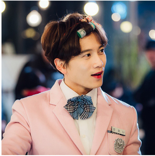
安約娜帶來不少喜劇效果。

溫文儒雅的車道賢、暴力衝動的申世奇、擅製炸彈的佩里朴、有自殺傾向的安約瑟、追星族少女安約娜、神秘的魔術師Mr.X和抱著泰迪熊的小女孩NaNa，這些人格是車道賢心的碎片，因為無法承受太痛苦的經歷，而分散成七個人格承擔。他們在劇情中都有其代表的意義，其中，申世奇為承載著痛苦的碎片，也是主角的黑暗面，他總是在主角感到害怕時出現，卻也是與主角對立的存在。而安約瑟象徵著主角對於人生的放棄或堅持，在主角的心境轉折中有著舉足輕重的地位。另外，安約娜的花癡、毒舌和男扮女裝的外貌有著十足的喜劇效果，穿插於沉重的劇情中有相當大的調劑作用。