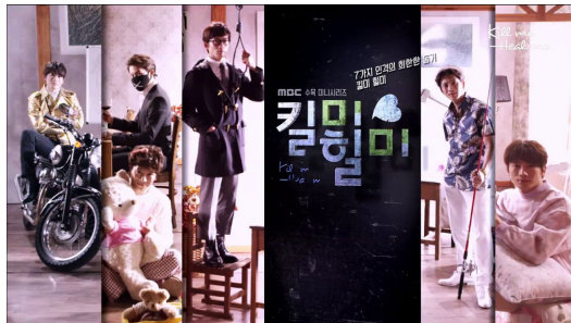
【Kill me heal me】劇照。

描述精神科醫生與作家愛情故事的韓劇【沒關係是愛情啊】於二〇一四年開播後獲得廣大迴響，之後，精神疾病題材的韓劇如雨後春筍般出現，其中【Kill me heal me】（殺了我治癒我）以人格分裂症為題材，描述主角車道賢克服頑疾、面對過去以及追求愛情的心路歷程，溫馨之餘帶有勵志意涵。