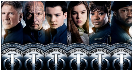
阿薩·巴特菲爾德(左三)與海莉·史坦菲德(右三)等人主演電影【戰爭遊戲】。

除了有老牌影星與奧斯卡影帝、影后出演外，為了配合故事情節，大部分角色由年輕演員擔綱，這些演員雖然年輕卻有著豐富的演出經驗，演員們豐富的資歷與精湛的演技令電影更顯生動。