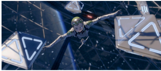
軍事學校的訓練方式多半都是以遊戲的型式進行的。

戰爭與遊戲的關係，則是電影【戰爭遊戲】探討的另一個重點，主角安德·維京從最初級的軍事學校一直升到指揮官學校，校方的訓練方式多半都是以遊戲的型式進行的，在最終大戰前的模擬演練，就好像是大型多人線上角色扮演遊戲般精彩刺激。