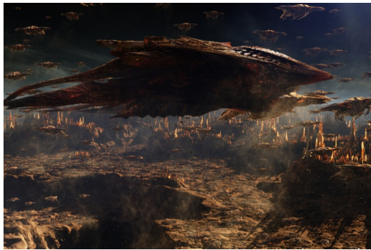
蟲族集結艦隊蓄勢待發。

電影【戰爭遊戲】於二〇一三年十一月上映，由蓋文·胡德（Gavin Hood）執導，改編自經典科幻小說《安德的遊戲》，在未來的世界中，人類受到外星種族蟲族的入侵，為了徹底地擊敗蟲族，人類成立了專門的軍事學校，希望能培養出軍事奇才以擊垮蟲族，主角安德·維京天資聰穎，被軍事學校的校長希倫·格拉夫（Hyrum Graff）上校看中，期望他能成為人類的救世主，帶領全世界擊敗強大的蟲族。