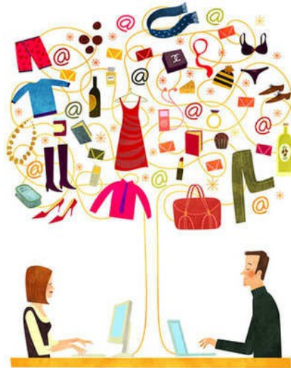
近年來不少人利用網路進行二手物品的交易，也促成線上二手交換平台的興起。

現代電腦技術發展成熟，網際網路日益普遍，線上交易與拍賣網站也隨之興起。由於網路有著跨距離與零時差的便利性，打破傳統商業交易在地理與時間方面的限制，加上成為買家及賣家的門檻相對較低，這樣的特性不僅吸引不少二手交易平台由實體店面轉變為網路商家，也為想將二手物品脫手的個人賣家提供一個便捷的販售管道。