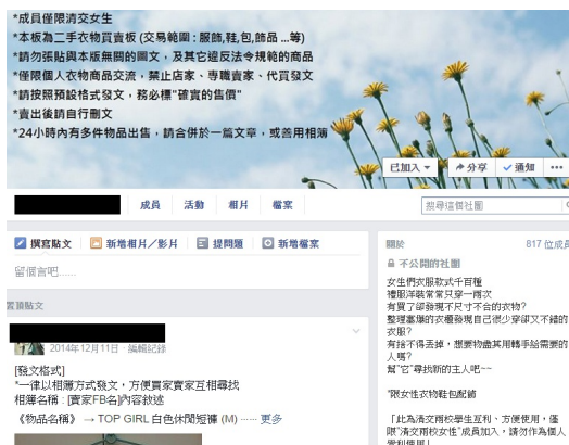
近年來有許多以學校作為創建單位的二手拍賣社團紛紛成立，對成員身分有 特殊的要求與限制。

另一種社團分類方式，則是採用售物者所在的位置作為群組創建依據，大至一個縣市，小至一個學校甚至是一個系別，在Facebook中都存在著相關的二手交易社團。通常欲加入這類的社團必須先經過資格的審查，確保成員身分與規定相符，也因此造成區域範圍越小，成員之間彼此的信賴感越高的情況。近年來有許多以學校為創建單位的二手拍賣社團，皆屬於此種性質，因其對成員身分的要求與限制，不僅控管了買家與賣家的素質，社團成員彼此所在的位置也較為接近，因此交易多可採用面對面交貨、驗貨的方式，有效降低網路買賣的風險。