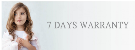
目前在網路上常見的二手交易屬於C2C的形式，這樣的買賣行為並不適用於七日鑑賞期的規範。

目前在網路上常見的二手交易屬於C2C（Consumer to Consumer）形式，指的是個人透過國際網路，與同屬個人的買方或賣方進行交易，這樣的買賣行為並不適用於所謂的七日鑑賞期。根據《消費者保護法》第十九條規定，不論是二手或是全新商品，交易的對象必須是企業經營者，消費者才能享有七日鑑賞期。也就是說，除非向那些專門販售二手商品的立案店家購買，否則一般網路上個人將二手貨物拿出來進行拍賣的交易，是沒有七日鑑賞期保障的。