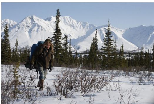
跟隨著克里斯的流浪旅途，影片全程取景大自然，使觀眾能夠一窺山林、大海、冰川、沙漠等不同的景緻，更藉由紀錄自然的力量體現人類的渺小。

然而，反觀現今人類以「高高在上的文明」，無所不用其極地掌控與剝奪自然，而那份原始的景仰也已接近蕩然無存的程度。【 荒野生存 】真實紀錄著大自然的力量，體現人類的渺小，同時提及「人類不必變得強壯，而是感受強大」的概念，引領觀者反思社會的現況，如何在發展與保育之間取得平衡，這也正是二十一世紀不變且關鍵的議題。