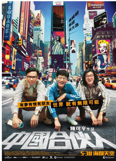
【中國合伙人】電影海報。

「有夢、有情、有朋友，世界就有無限可能。」以紐約街頭做背景，電影【中國合伙人】（臺灣譯作【海闊天空】）的海報上寫著這樣的標語。導演陳可辛將劇中時間聚焦在一九八〇年代至二十一世紀，這變動相當大的三十年，以三名男子的境遇，道出中國人的心聲，他們為了什麼而奮鬥、為了什麼而改變。