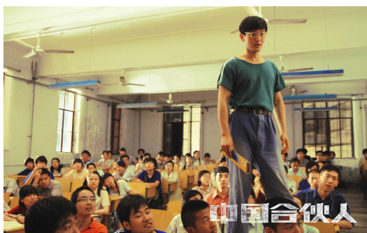
演員黃曉明飾演「土鱉」成東青一角。

成東青扮演老實而俗氣落伍的「土鱉」，孟曉駿是喝過洋墨水的「海歸」，王陽則是懷有激進民族主義的「憤青」，導演陳可辛的安排頗符合當代中國學生的代表類型。演員黃曉明將成東青飾演得淋漓盡致，出身鄉村的他考了三次高考才進入大學、拿了高學歷，畢業後在中國卻只能當小學英文老師，從頭到尾擺脫不了一身的「土氣」；王陽則是一名文藝青年，留著一頭長髮、與美國女生談戀愛，但畢業後不僅女朋友離開了，寫的詩也沒人想出版，只能隨風飄蕩。兩名不得志的人因緣際會下開設了英語補習班「新夢想」，以幽默、貼近生活的方式博得學生的歡迎，從只能佔用速食餐廳的小班級擴張至兩千人的規模。