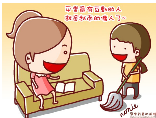
和她聊天像是每天必須做的事情，我常常跟她說我在學校發生的事情，也常常自認為是老師地教她講中文。