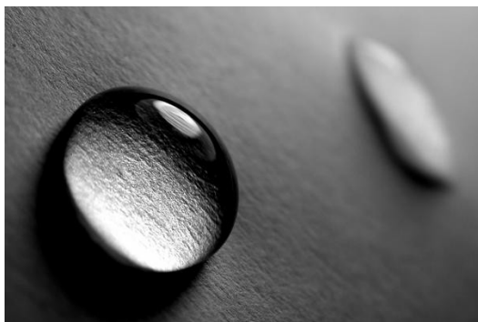
我一直無法忘記六年前，自己害她掉下的那滴眼淚。

當下我沒有反駁，也沒有因為所謂的「民族意識」而對她生氣，因為我一直記得六年前，自己害她掉下的那滴眼淚。