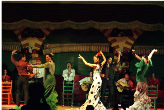
熱力四射的佛朗明哥舞者在臺上，曼妙地展現南歐專屬的舞蹈，

每個在場觀眾的靈魂都隨著音樂的節奏而受到震撼，而我在此時則是看出了神，我在思考，這樣一個熱情的舞蹈是如何引領著西班牙的人民培養出熱情的民族特性，但在掌聲響起的那刻我明白了，這是一個多麼有吸引力的表演，在每一個強而有力的踏步中讓人的心情受到鼓舞，讓觀眾也想要跟著他們一起跳舞、享受這美好的時光，我認為這就是佛朗明哥舞蹈一直到現在都是西班牙不敗經典的原因，如果未來還有機會，我一定會再回來西班牙這熱情的國度然後再次享受佛朗明哥的陶冶。