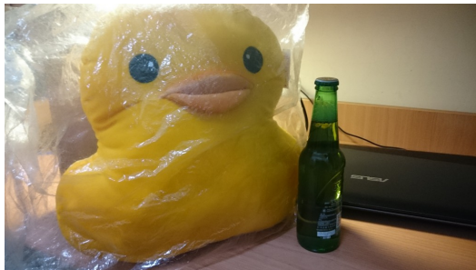
套圈圈意外得到小鴨，和基本戰利品「酒瓶」。

就這樣套圈圈回到了我的生活。每到一個新的夜市就會開始四處張望，找尋是否有套圈圈的攤位，只要有，就一定會停下來丟一串圈圈後才捨得離開。當然自己在套圈圈的技術上也成長許多，原本從丟中一瓶飲料就滿足，到現在越是駕輕就熟，最好的成績是丟到一隻布娃娃。還記得有次讓我哭笑不得的經驗，那時我正在試著丟很喜歡的大娃娃，結果有一個圈圈就這樣擊中大娃娃那一層的瓶子側緣，而後反彈進前面一層的瓶子上，就這樣，我莫名得到一隻黃色小鴨玩偶。