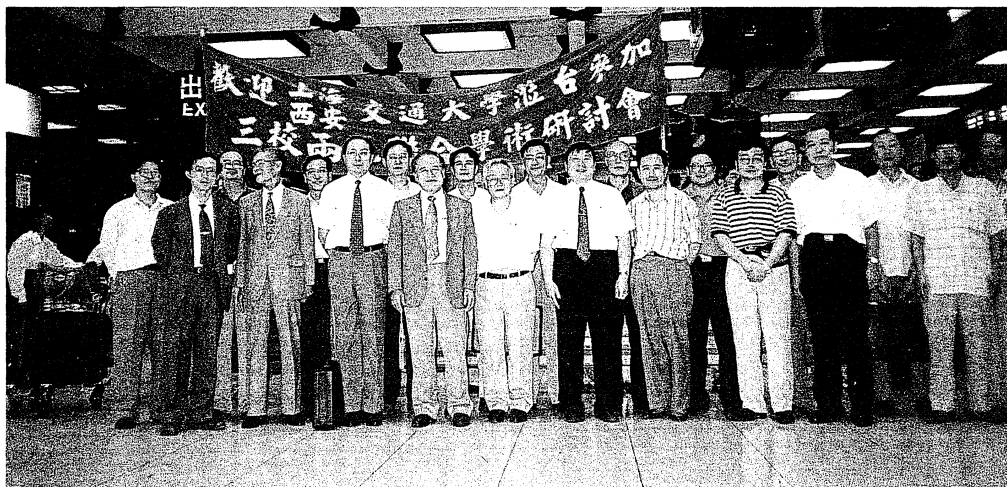
兩岸三地學術研討會成員於機場合影

兩岸交大在歡渡百年校慶後，各自跨出學術交流的第一步。在兩岸交大校長都有意做更進一步交流的默契下，未來究竟如何？且讓我們拭目以待！