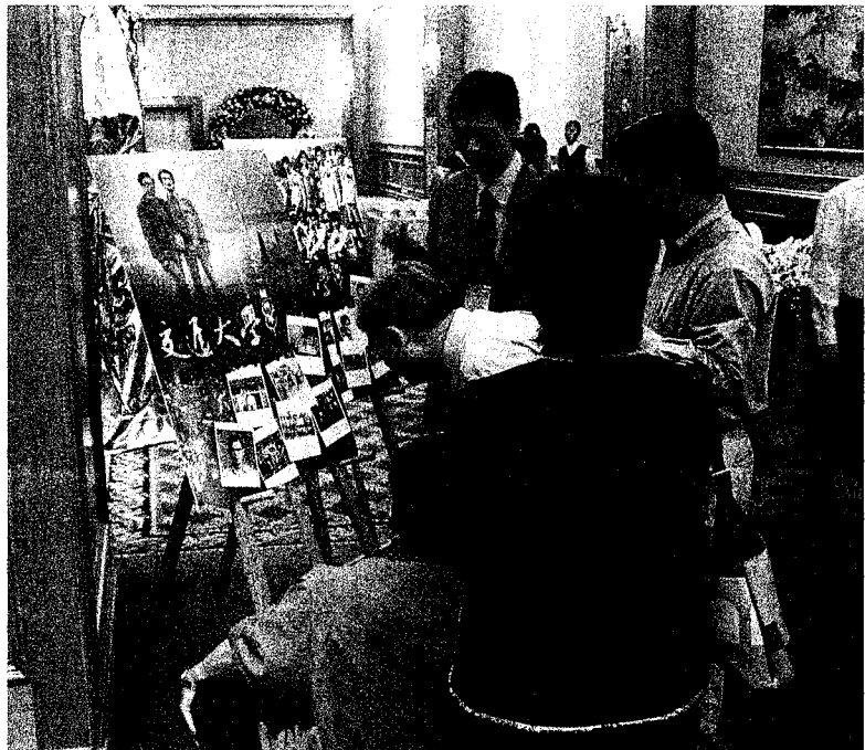
▲ 學長們端詳海報上的老照片

接著由璞玉計畫安排進行了兩個別出心裁的活動：每位師長都獲得一個精緻的糖罐，裡面裝滿了學長們懷抱著敬愛而寫給老師的秘密紙條；而今天與會的學