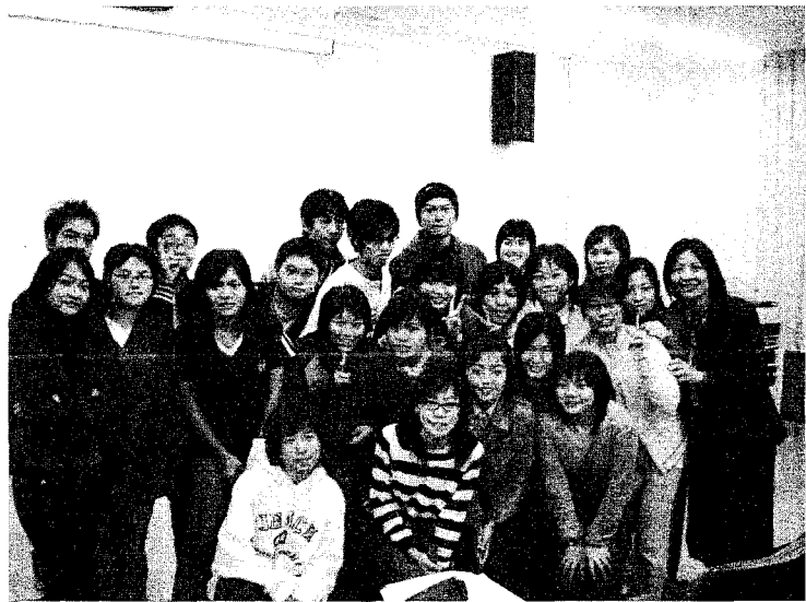
照片一：新生報到日，交大客家文化學院提供

截至目前為止，似乎已經回答了常問問題中的前兩題。至於與清大人社系的差異，那就是我們特別提供的客家文化知識了。從這次專刊的其他文章中，讀者可以明顯感受到學生從大一開始，就有很深切的客家體認，不論自己是否為客家人，能夠有機會接觸客家族群，進而由此認識台灣多元文化的深層意涵，都是難得而寶貴的經驗。校園裡（以及隔壁的科學園區）雖瀰漫著尖端科技的冷調氣氛，但我們學生的養成卻充滿了人文關懷和參與社會的暖色光環。這是通識教育的最高層級，即使才入學一年，已使某位同學感嘆說：「比較上學期剛進交大時的團體照和現在拍的合照，同學們的氣質都改變了——每個人都變