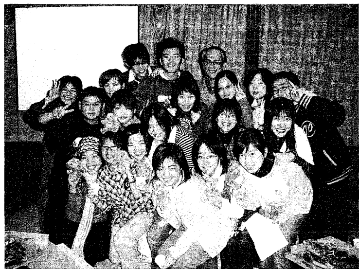
照片二：年終歲末歡唱