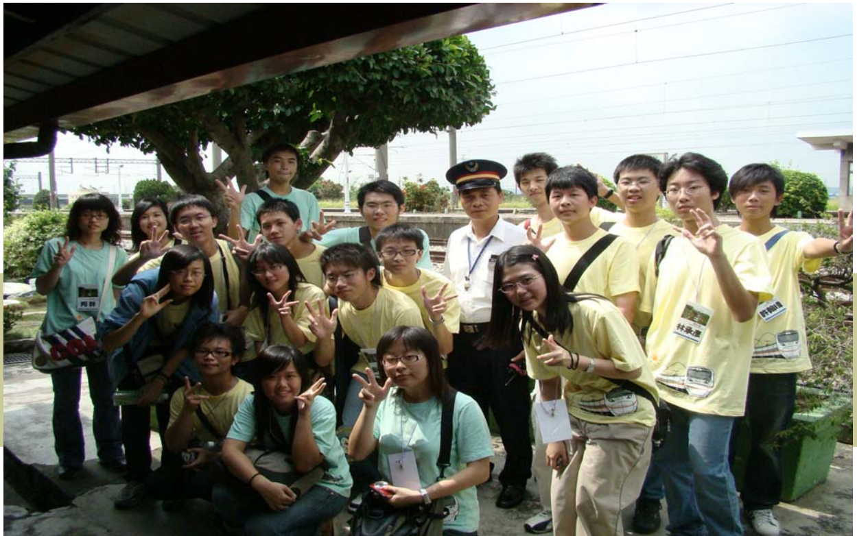
▲2007年鐵道文化營到追分車站出遊的合照