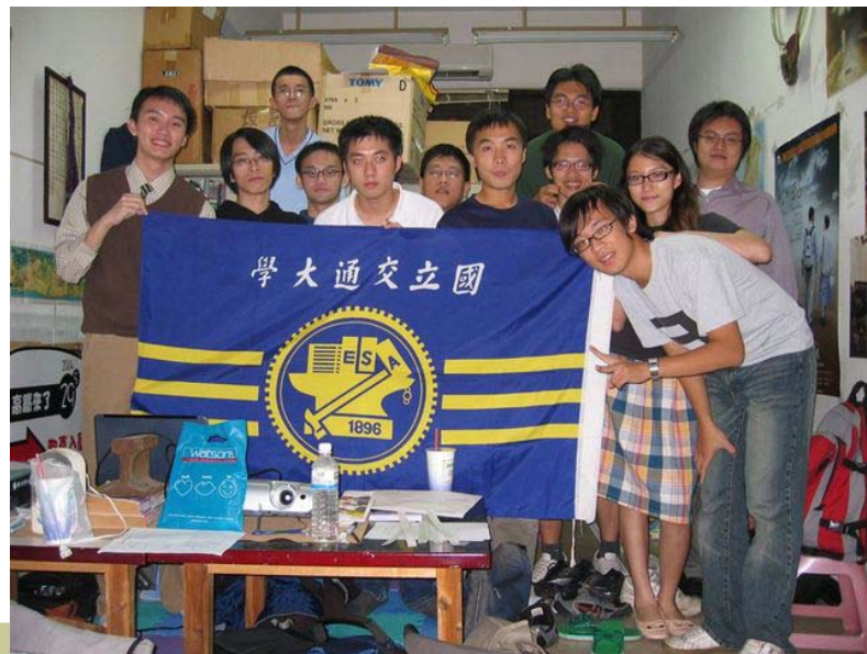
▲上圖為 2007 年鐵道文化營工人和學員到平溪出遊合照；下圖為 2006 年社課結束後，會員和講師的合照

上「本」，只見兩張 B4 白報紙上盡是手工編輯與刻板的老報刊模樣，「那年代也沒辦法做什麼精緻印刷，寫一寫貼一貼就寄給社員了，」黃柏文帶著微笑解釋道。不過可別小看這兩張喔！對老鐵道迷來說，這可是當時資訊網路不發達的時代裡唯一能取得台灣鐵道新情報的管道，地位非常重要呢！