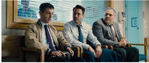
兄弟情誼讓漢克的家庭更加圓滿。