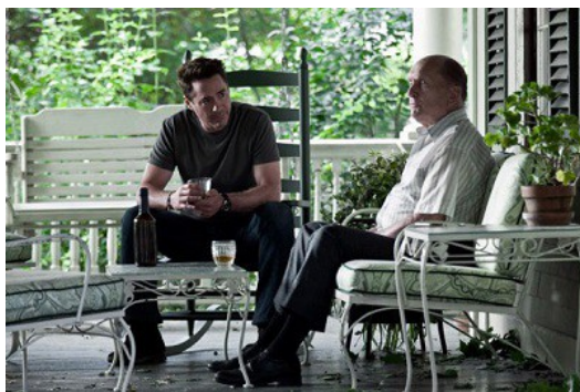
漢克與父親關係惡劣，兩人互動冷淡。

因為職業的關係，從小漢克的父親使用相當嚴厲的教育方式來教導兒子，但年輕時的漢克放蕩不羈，到處惹事生非，甚至發生車禍害得哥哥斷送大好的棒球生涯，父親不得已將他送進少年觀護所。就是這個導火線使得父親和漢克之間產生心結，父親認為自己疏於管教才讓兒子造成無法抹滅的傷害；而漢克心中在意的卻是父親的怪罪與他被漠視的心情。