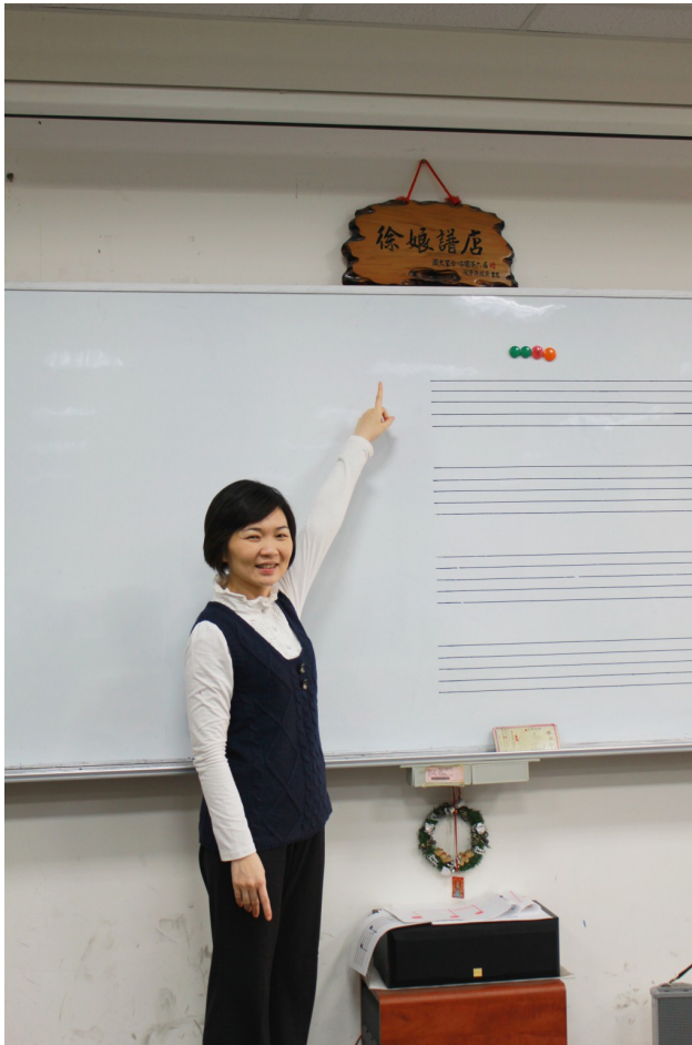
上面的牌匾是老師的學生送的，因為老師的學生曾經互相開玩笑說老師是賣譜的。