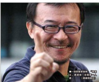
黃連煜在錄音室裏唱著他最新的作品「只有客家人」。

人稱客家王的黃連煜，2008年的專輯《Only Love》竟是用台語為主調，對他來說，有沒有「客家心」才是最重要的。在這張專輯主打的《客家小炒》裡面是句歌詞就寫到：想要炒出客家味，一定要有那顆客家心，要有客家心，正(才)有客家味。