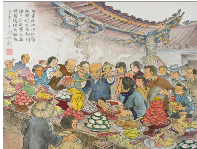
■廟會酬神很熱鬧，親朋好友全都到。論斤計兩賽大雞，得獎還得放鞭炮。劉興欽的水墨民俗畫描繪客家早期生活。(取材自：好客竹縣)