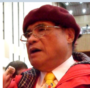
■劉興欽亮黃的卡通領帶有種幽默的氣質。

邁入老年的劉興欽，回到山中親自下田種菜過著恬淡生活，在農忙之餘將記憶中點點滴滴的客家印象記錄下來，用墨彩描繪客家早期的田園風光，開始台灣民俗畫的嘗試創作。