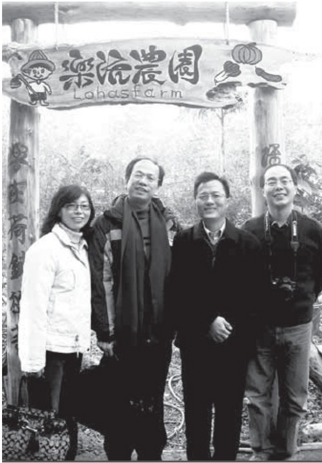
樂活農園的牌匾是用吳濁流當年種下、一棵枯死的七十幾歲老槭樹雕成的，讓學生見證廢物利用。