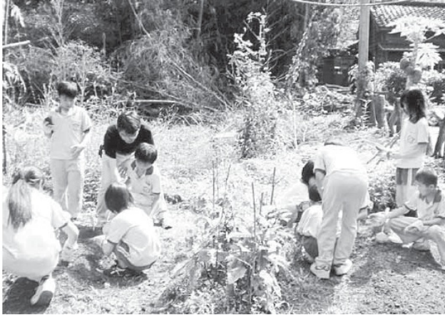
新竹縣錦山國小成立樂活農園，鼓勵小朋友參與農業生活，和土地建立親密的感情。

何明星說，「一開始只是接受邀請自然地就去幫忙，但時間久了，越做越深入，別人就會認定你，就會有更多機會接觸它。」幾年之後，何明星與新竹縣各領域一群對歷史文化有興趣的人，組織了「兩河文化教育協會」。「兩河」代表頭前溪與鳳山溪，他們的推廣並非受限於客家，成員裡也有幾位是泰雅文化工作者，代表對新竹縣文化推動工作有興趣的人組織的協會。何明星說到這，語氣裡添了些興趣，他表示，兩河文化協會是個民間團體，早期有做一些文化性的推廣活動，包括社區營造、振興地方文化觀光產業等等，「二〇〇〇年還有舉辦全球客家文化節喔！」