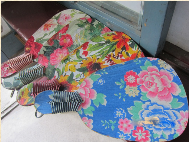
有著客家人節儉意象的檳榔扇，經過當地學童的彩繪，成了驛站內的文創商品。

站內也販賣各式各樣的客家商品，像是花布頭飾、拼布包、客家香包等等。往站外一瞧，驛站旁是完善的日式車站員工宿舍，澡堂、柴房、古井保存完善。台鐵原本想要撤站，並拆除舊有建築，但因為在此拍攝連續劇「四月望雨」的演員們和竹田車站培養出深厚的情感，便結合在地人士展開爭取，而使竹田驛站保存下來。