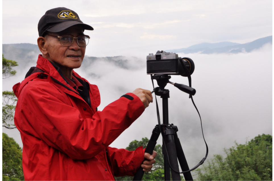
鍾情於天地山水，李松茂總是不畏自然環境的險惡，親臨現場攝影。

「會照相不等於會攝影。照相靠技術，攝影還得靠美術。美術應用與藝術素養不是天分，而是要日積月累去學習才能養成。」談起攝影，年過七旬的李松茂就像小孩一般開朗熱情，眼神中卻有著不容動搖的堅定，散發出攝影大師對藝術的驕傲與信念。