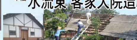
客家古鎮，是客家文化的重要載體。這裡不僅有客家建築、客家音樂、客家舞蹈，更有客家歷史、客家風俗、客家習俗。