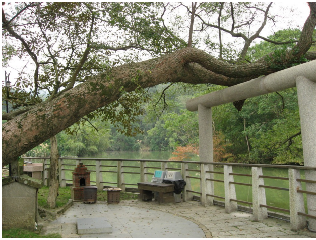
在三叉埤旁，社區用「鳥居工法」支撐傾斜的老樹，防止它壓垮左下方的石版伯公廟。