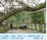
桐山社區，是客家文化的重要載體。這裡不僅有客家建築、客家音樂、客家舞蹈，更有客家歷史、客家風俗、客家習俗。