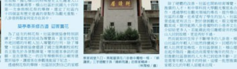
客家古鎮，是客家文化的重要載體。這裡不僅有客家建築、客家音樂、客家舞蹈，更有客家歷史、客家風俗、客家習俗。

探訪·圖記 老大選 情更切 老大選，是客家文化的重要載體。這裡不僅有客家建築、客家音樂、客家舞蹈，更有客家歷史、客家風俗、客家習俗。