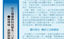
客家大院，是客家文化的重要載體。這裡不僅有客家建築、客家音樂、客家舞蹈，更有客家歷史、客家風俗、客家習俗。