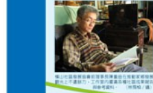
客家古鎮，是客家文化的重要載體。這裡不僅有客家建築、客家音樂、客家舞蹈，更有客家歷史、客家風俗、客家習俗。

客家古鎮，是客家文化的重要載體。這裡不僅有客家建築、客家音樂、客家舞蹈，更有客家歷史、客家風俗、客家習俗。客家古鎮，是客家文化的瑰寶，也是客家文化的驕傲。