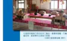
客家古鎮，是客家文化的重要載體。這裡不僅有客家建築、客家音樂、客家舞蹈，更有客家歷史、客家風俗、客家習俗。