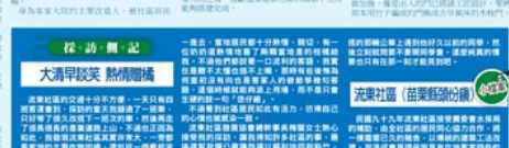
客家大院，是客家文化的重要載體。這裡不僅有客家建築、客家音樂、客家舞蹈，更有客家歷史、客家風俗、客家習俗。